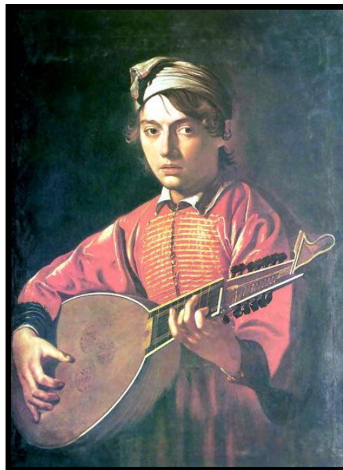
Atribuido a Caravaggio, 1597