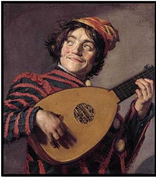
Frans Hals - The lute player - 1623